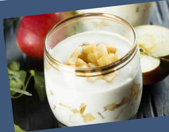
Pirnen mit Naturjoghurt